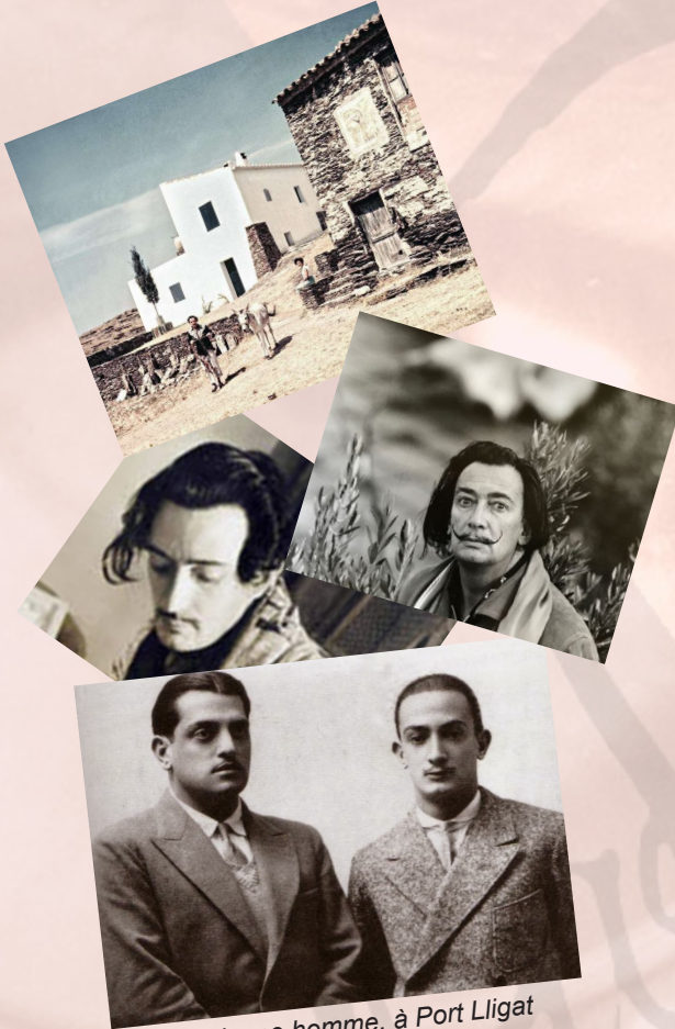
Dali, jeune homme, à Port Lligat puis avec le jeune Buñuel

Luis Buñuel était pour quelques jours à Cadaquès l'invité de Salvador Dalí au moment des fêtes de Noël, en 1928. Ces deux très grands noms de l'art au XXe siècle étaient encore deux parfaits inconnus, dont l'amitié remontait au temps de leurs études à Madrid. Buñuel a ainsi raconté cet épisode :