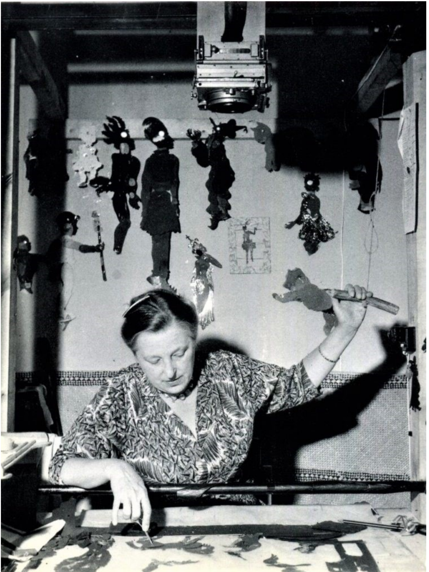
Lotte Reiniger positionnant une silhouette sur sa table de banc-titre, unique technique personnelle connue à ce jour dans le septième art. Elle fut la pionnière dans l'histoire du cinéma à avoir fusionné les ombres chinoises et l'animation. Elle est née le 2 juin 1899 à Berlin. Elle meurt le 19 juin 1981 à Dettenhausen - Allemagne.